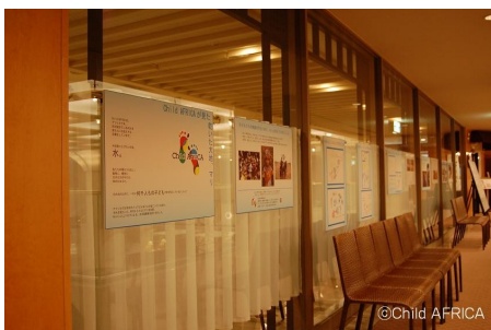
Art for Africa!実施の様子@ホテル日航福岡

マリの子どもたちが描いた「水のある生活」の絵を展示。清潔で安全な水を得ることが子どもたちの生活をどのように変えるのかを、来場者に向けて発信しました。