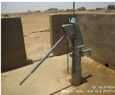
ユニセフとVolvic 1ℓ for 10ℓプログラムの支援で設置が進められている手押しポンプ付の井戸

その二つが同時に実践されることで、子どもたちが自分の力で健康を維持する力を身につけることができます。