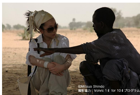
現地の人の声に耳を傾けて初めて分かることも多い