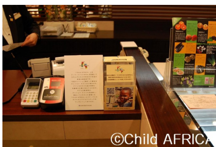
募金活動の様子@ホテル日航福岡