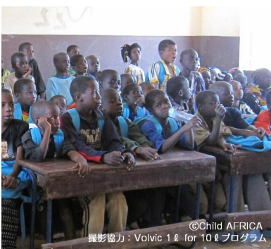
ユニセフ支援校にて。授業を受ける子どもたち